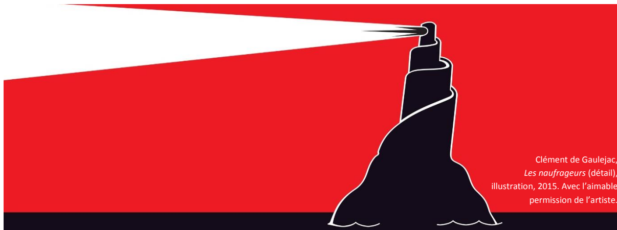
Clément de Gaulejac, Les naufrageurs (détail), illustration, 2015. Avec l'aimable permission de l'artiste.