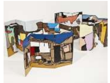
Formes de vie de Denis Bordeleau , techniques mixtes sur carton d'emballage, ±270 x 270 cm. 2014